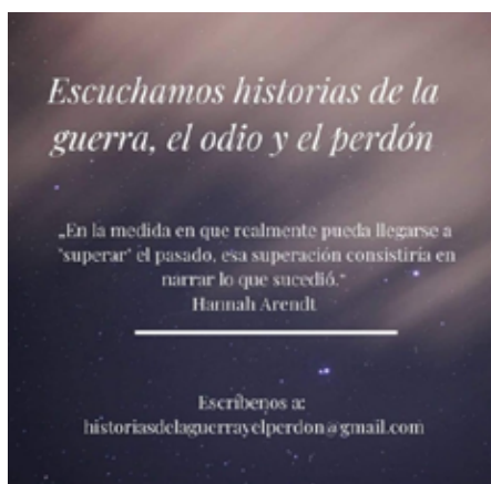
Figura 1. Póster digital diseñado para convocar a personas a contar sus historias relacionadas con la guerra.