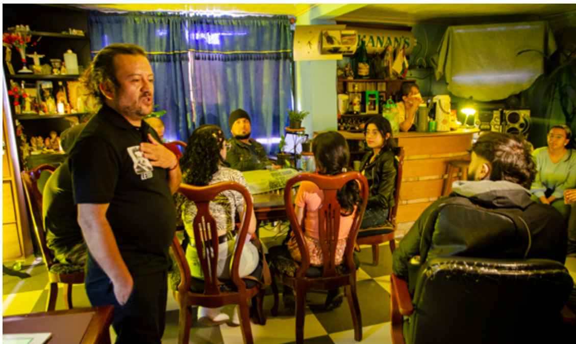
Figura 4. Bienvenida a los visitantes de la Casa-Museo de los objetos normales.