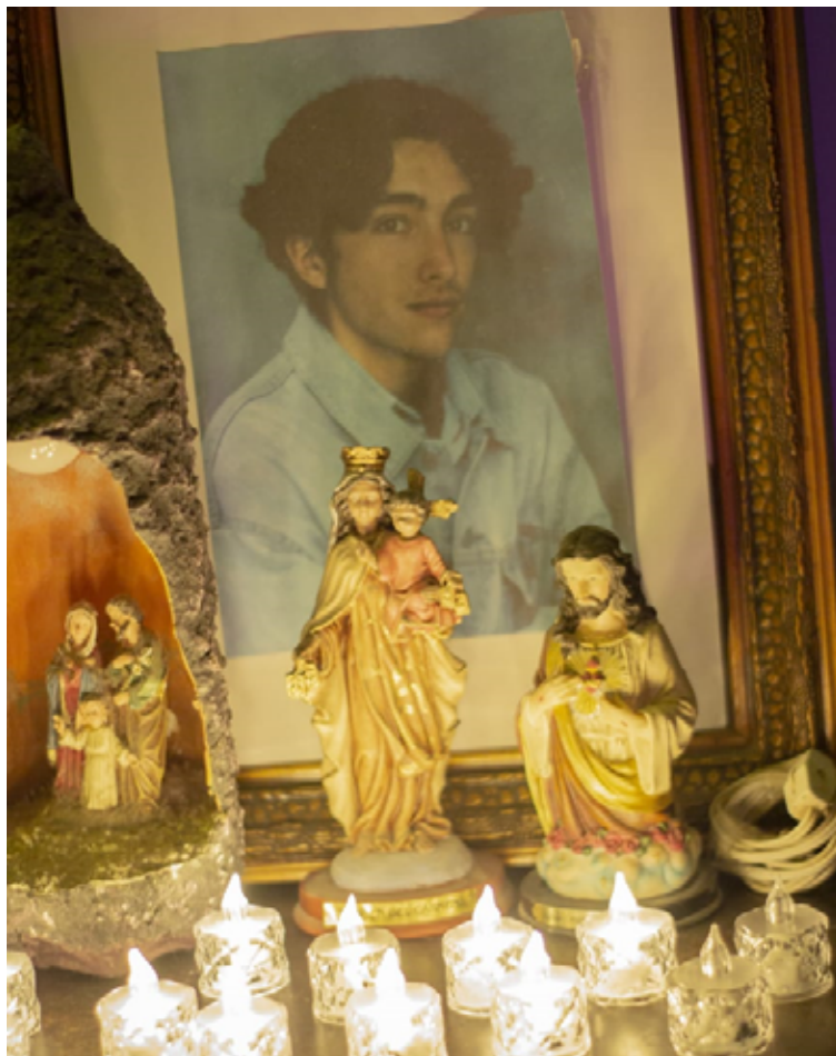
Figura 9. Altar de Vicente.