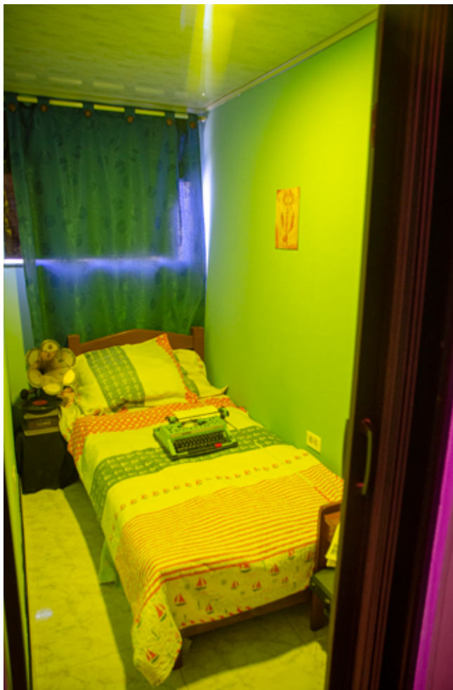
Figura 7. Habitación de Walter Benjamin.