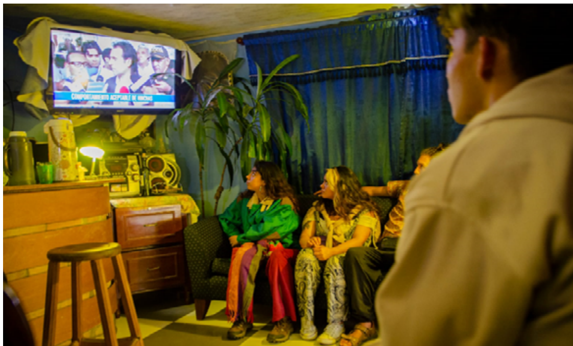
Figura 11. Visitantes observando los fragmentos del acto 5.